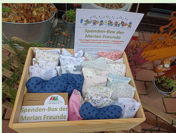
VORHER (beim Aufstellen im AGO)

Wer selbst noch Interesse an einem Kirschkernkissen hat oder eine weitere Idee für ein Aufstellen der Spendenbox, der kann sich gerne bei uns (Förderverein oder Elternbeirat) melden 😊