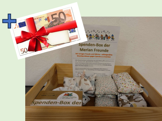
NACHHER (Stand heute) 😊